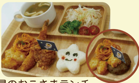
星のおこさまランチ エビフライ & からあげ / ハンバーグ 650 円

特定原材料 5 品目 (卵・乳・そば・落花生・かに) を原材料に使用していません。