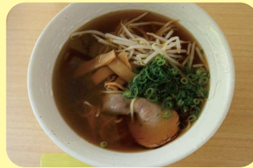
星の子ラーメン 580 円