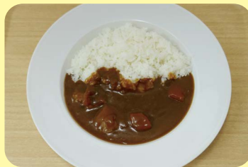
星の子カレー 600 円