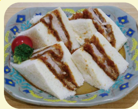
かつサンド 630 円