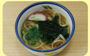
あったかうどん 400 円