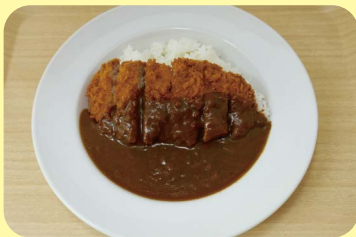
サクッとカツカレー 780 円